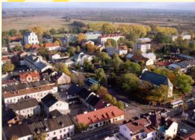
Góra Kalwaria z lotu ptaka