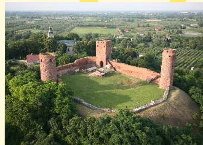
Zamek Książąt Mazowieckich w Czersku

W Szymanowie , nie tylko dla najmłodszych, dostępny jest już tor kartingowy Kart Arena, gdzie można na początku namiętnie najszybszego sportu wiatu. Na koniec podróży warto zregenerować siły i odwiedzić lokalnych cukierników, którzy poczęstuj słodczykami z ziemi czerskiej czyli Czerlotki .