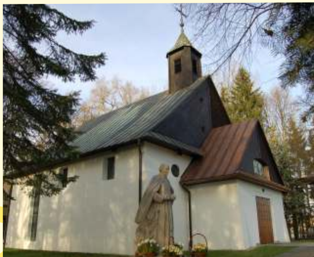
Wieczernik na Mariankach

Miłośnikami sztuki zachwyci zapewne unikatowa XVI-wieczna Pieta , jedna z najcenniejszych rzeźb woskowych w skali kraju. W barokowym wnętrzu kościoła pobernardyńskiego zobaczymy także XVIII-wieczne rokokowe ambon i sarkofag św. Waleriana wykonany z czarnego marmuru.